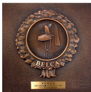
受賞者へ贈呈される賞牌