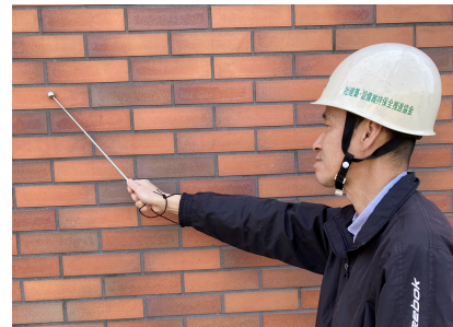
仕上診断技術者の業務の様子