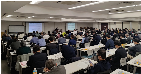
資格講習会の様子