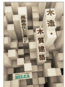
木造・木質建築 -長寿命化レシピ集 (令和6年刊行)